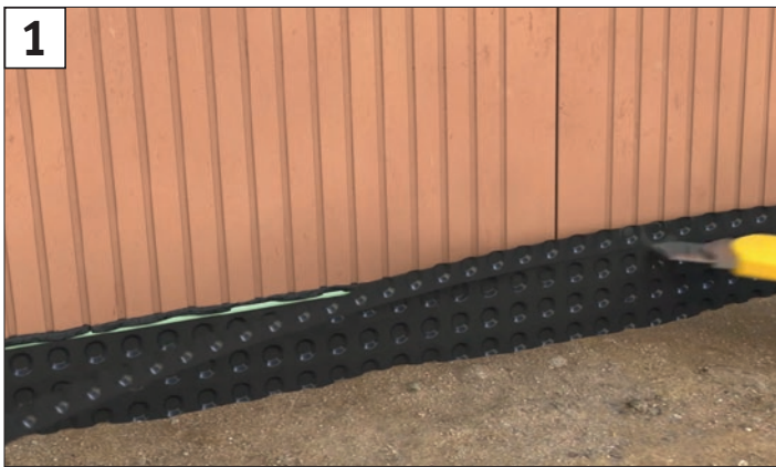
1 Noppenbahn gerade abschneiden