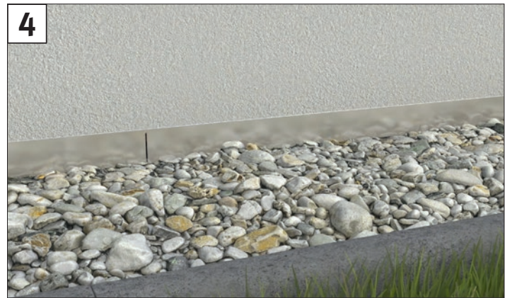
4 Hochwertige Edelstahloptik im Sockelbereich und ein sauberer Übergang von Putzfassade auf die Noppenbahn