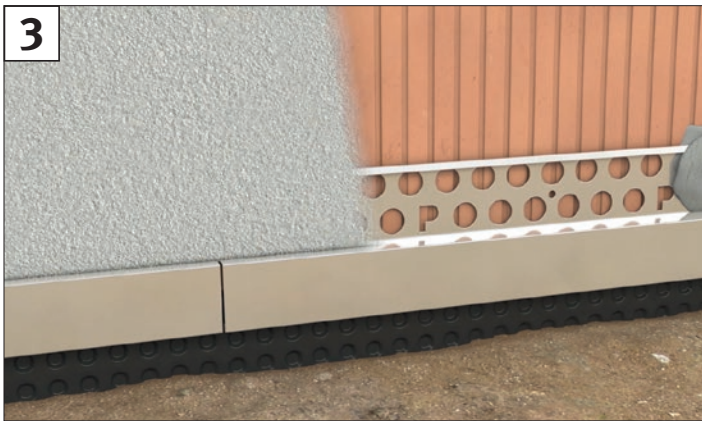
3 Noppenbahnprofil kann nach dem Aushärten der Ansetzbatzen auf 14 mm Putzdicke eingeputzt werden