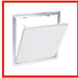
ZUM AUSHÄNGEN System F2 AK