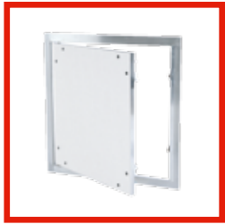
MIT FESTEN SCHARNIEREN System F1