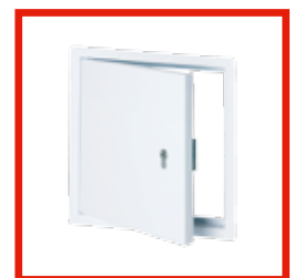
WEISS, MIT PROFIL-ZYLINDERSCHLOSS System B4