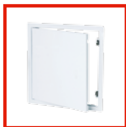
WEISS, MIT SCHNAPPVERSCHLUSS System B2