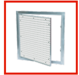
MIT LOCHPLATTE System F1/F2