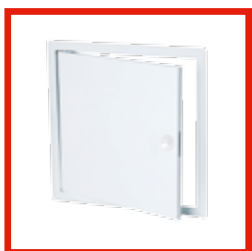
WEISS, MIT VIERKANTVERSCHLUSS System B1