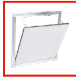
LUFT- UND STAUBDICHT System F2 AKL