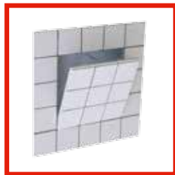
FÜR FLIESENBELÄGE System F3