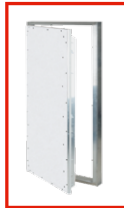
JUMBO-/DREMPELTÜREN System T