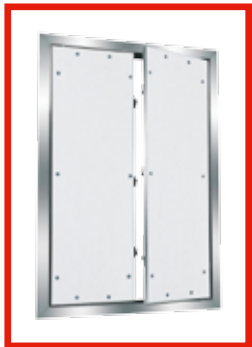
ZWEI- ODER MEHRTEILIG System F1/F2