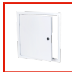
WEISS, MIT ZYLINDERSCHLOSS System B3